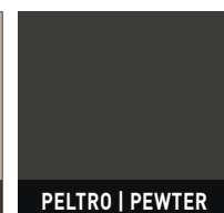
PELTRO | PEWTER